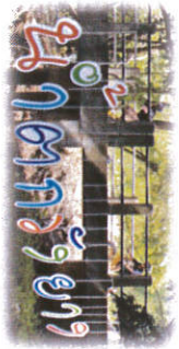
น้ำคาวังยาง