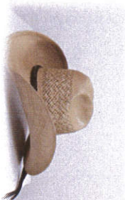
หมวกคาวบอย