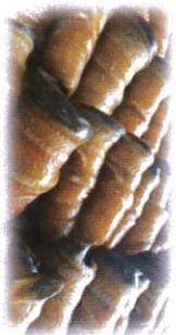
ปลาตุกเตตเดี่ยว