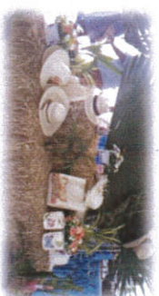
ผลิตภัณฑ์จากไผ่สาน