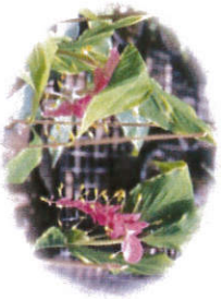
ดอกเข้พรรรยา